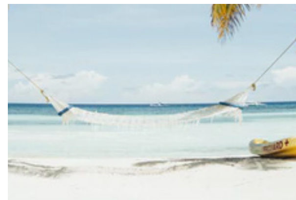
Estilo de vida